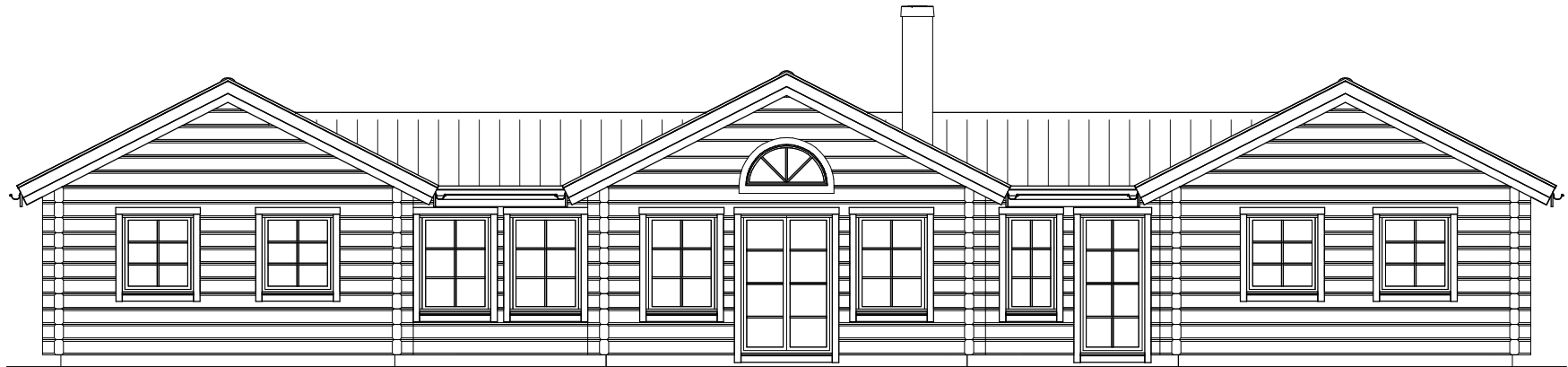
FASAD MOT BAKSIDA