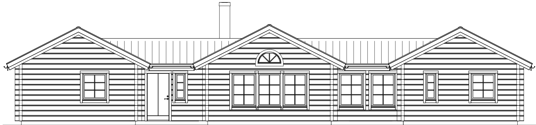
FASAD MOT FRAMSIDA