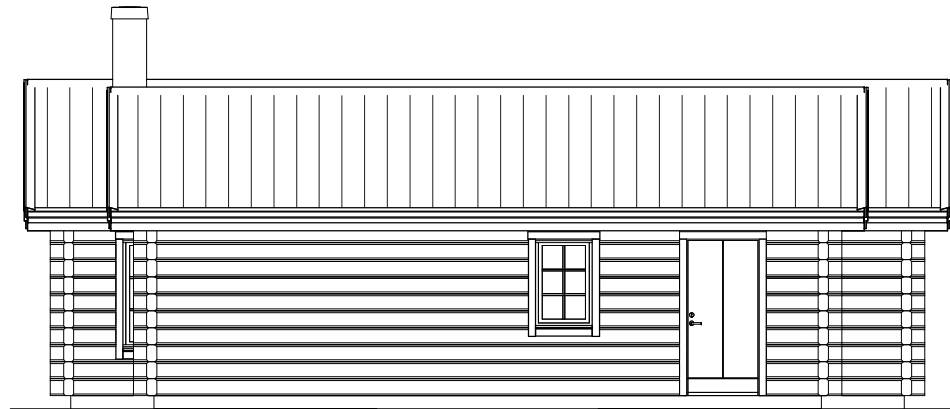
FASAD MOT VÄNSTER