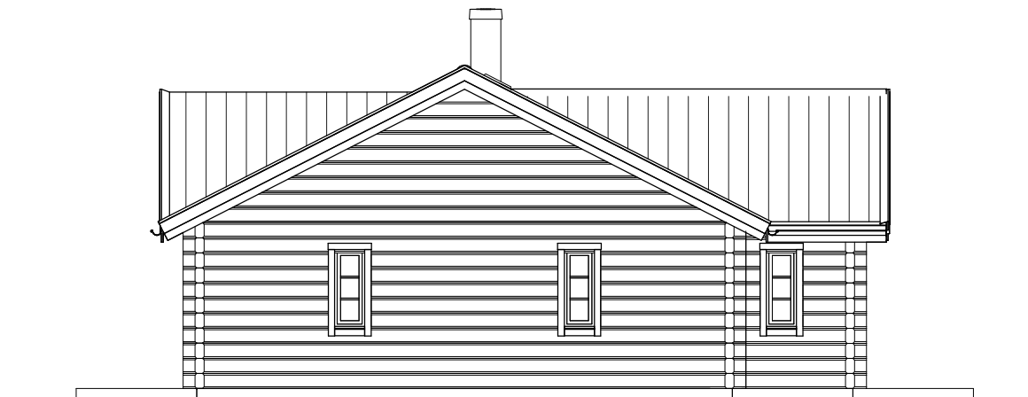
FASAD MOT HÖGER