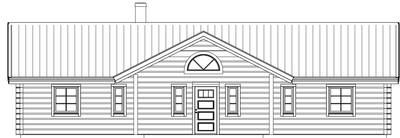
FASAD MOT FRAMSIDA