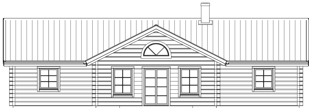
FASAD MOT BAKSIDA