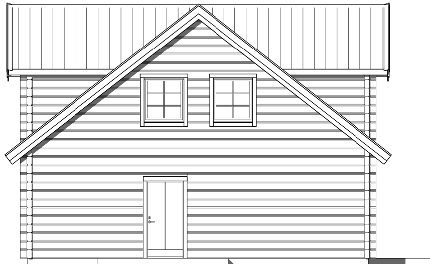
FASAD MOT VÄNSTER