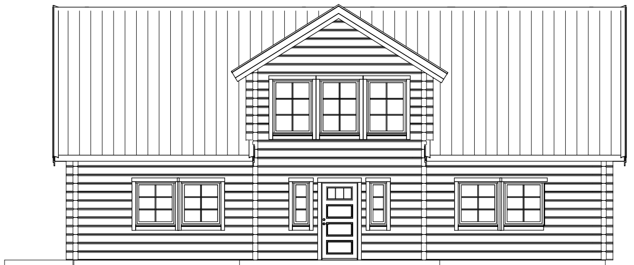
FASAD MOT FRAMSIDA