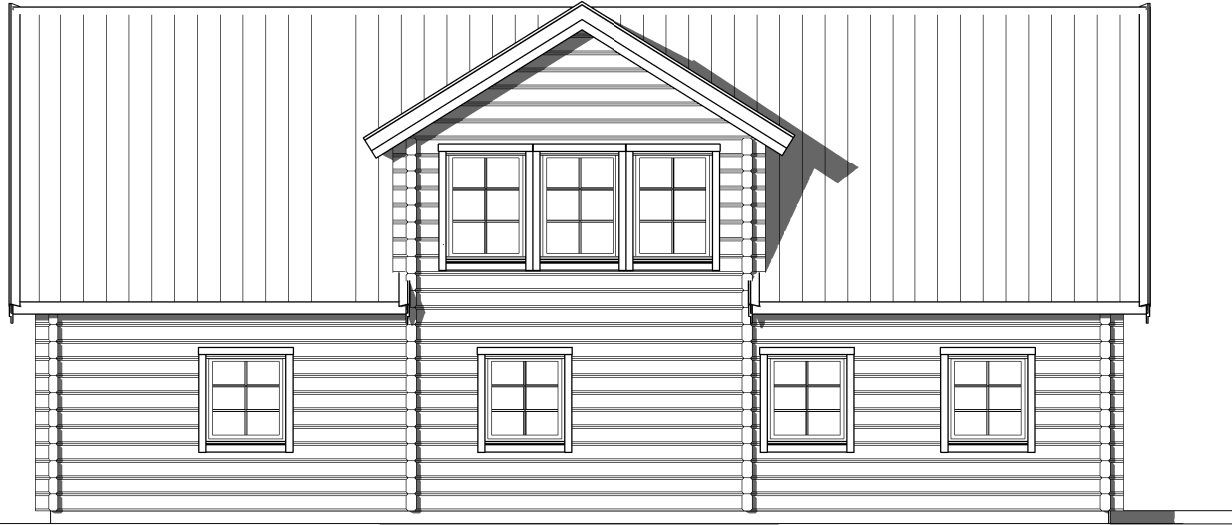
FASAD MOT BAKSIDA