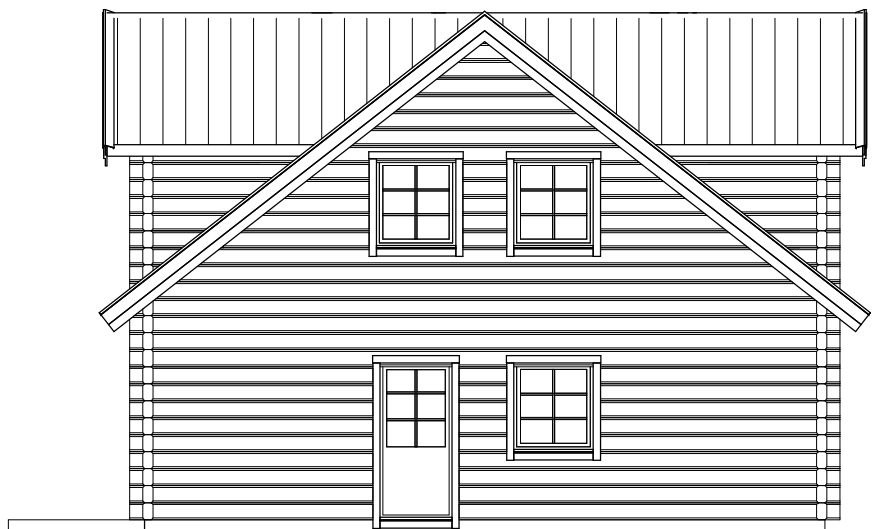
FASAD MOT HÖGER