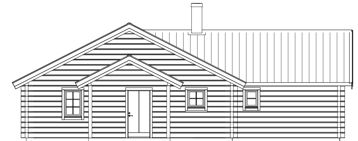
FASAD MOT VÄNSTER