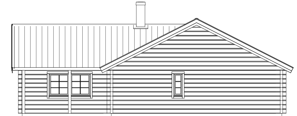
FASAD MOT HÖGER