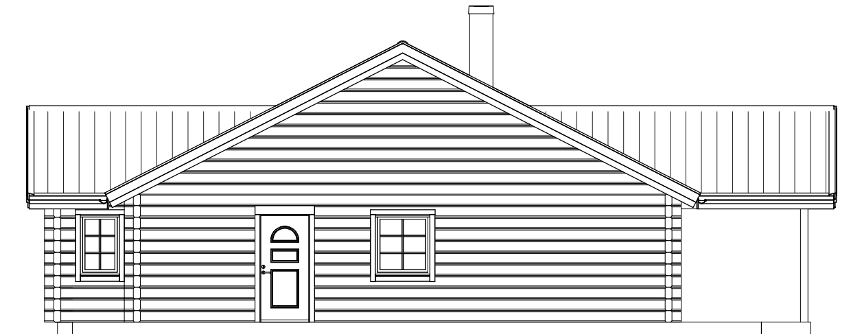
FASAD MOT HÖGER