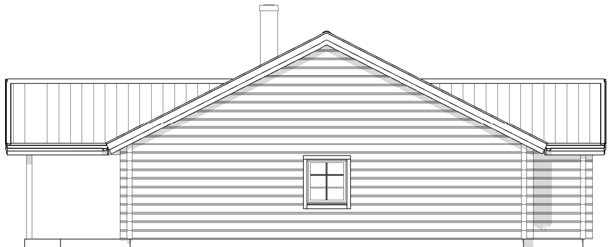
FASAD MOT VÄNSTER