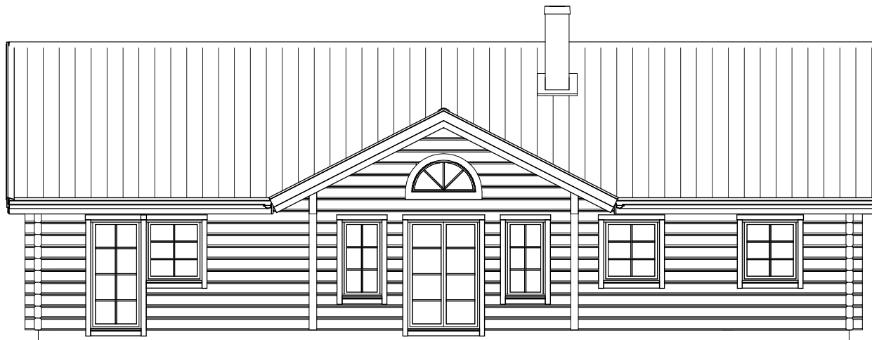
FASAD MOT BAKSIDA