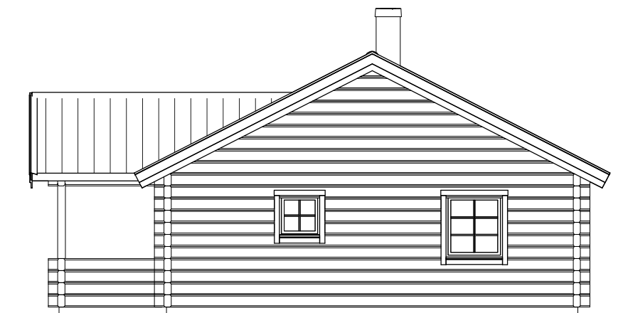
FASAD MOT HÖGER