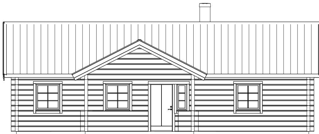
FASAD MOT FRAMSIDA